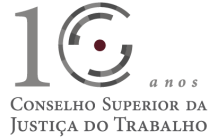
Fl. 2 - ANEXO ÚNICO DA PORTARIA Nº 171/2023-DG