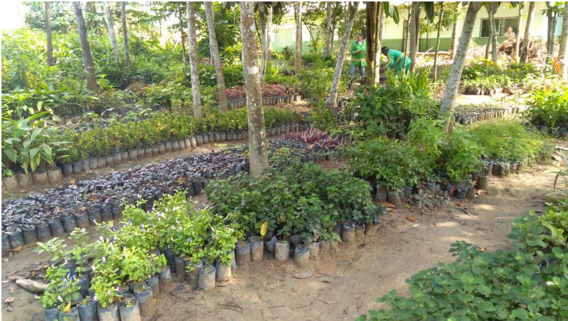
Mudas no Viveiro da Secretaria do Meio Ambiente da Prefeitura Municipal de Manaus

Para o desenvolvimento do trabalho relacionado à aspectos socioambientais no âmbito do Tribunal Regional do Trabalho da 11. a Região - Amazonas e Roraima, foram realizadas as seguintes ações: