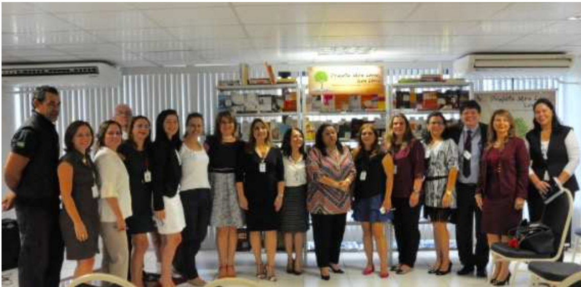
Equipe da Ejud, Biblioteca e Gestão Socioambiental do TRT 11 – AM e RR.

8.2. Reunião da Comissão de Gestão Socioambiental, em 10/08/16, para análise dos índices do PLS - Jud, mecanismos para maior efetividade nos levantamentos e das boas práticas apresentadas no Seminário promovido pelo TRE – AM em julho;