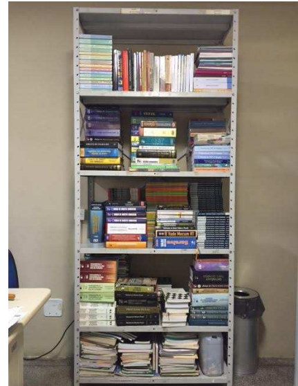
Material encaminhado à Biblioteca para utilização no Projeto.