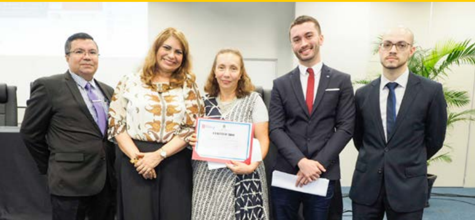
Concurso de Boas Práticas visa identificar e premiar as práticas positivas