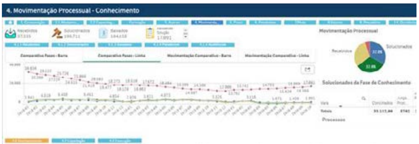
Tela de movimentação processual: um painel gráfico e explicativo com recursos de filtragem

O TRT11 avançou em tecnologia e gestão estratégica da informação com o lançamento do sistema Hórus TRT11. Trata-se de sistema de BI (Business Intelligence) que agrega informações estratégicas, táticas e operacionais do Tribunal, de diversas fontes de dados, com intuito de simplificar a condução de análises de negócio por meio de exibições gráficas simples e completas. A ferramenta tem como inspiração o primeiro sistema dessa categoria lançado no TRT-13 (Paraíba).