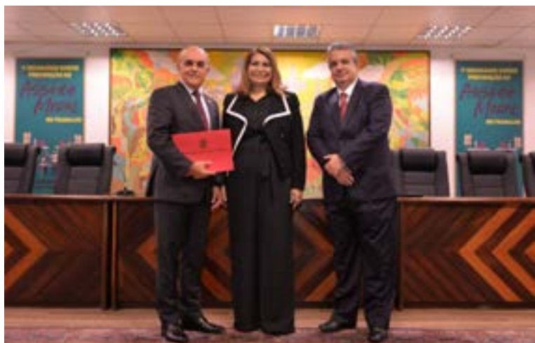
Ministro Claudio Mascarenhas Brandão palestrou sobre o papel das ouvidorias

variadas formas de assédio nas relações de trabalho.