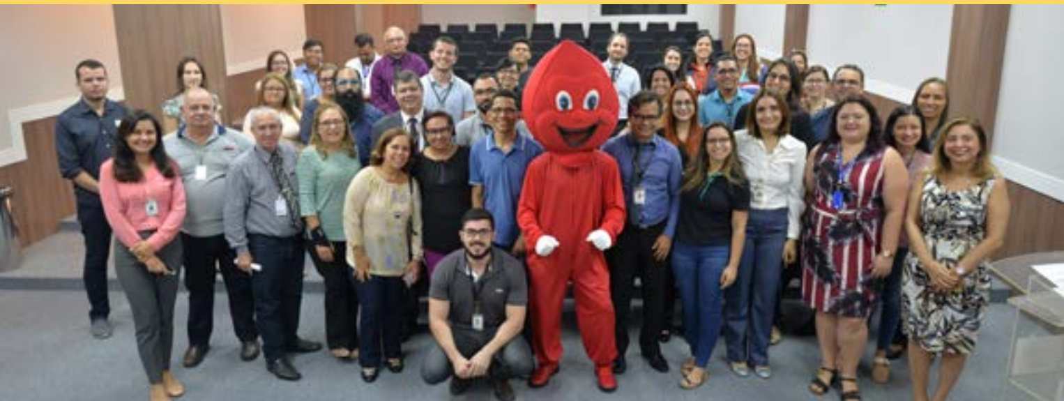
Lançamento do mascote "Veinha", para incentivar a doação de sangue no Regional