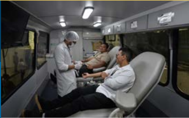
Campanha arrecadou 26 bolsas de sangue