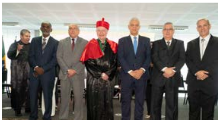
Congresso Internacional com o jurista Robert Alexy