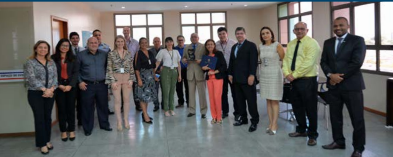
Equipe de gestores e diretores do TRT11 com o Desembargador Presidente