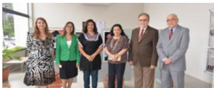
Abertura de exposição do Anexo Administrativo