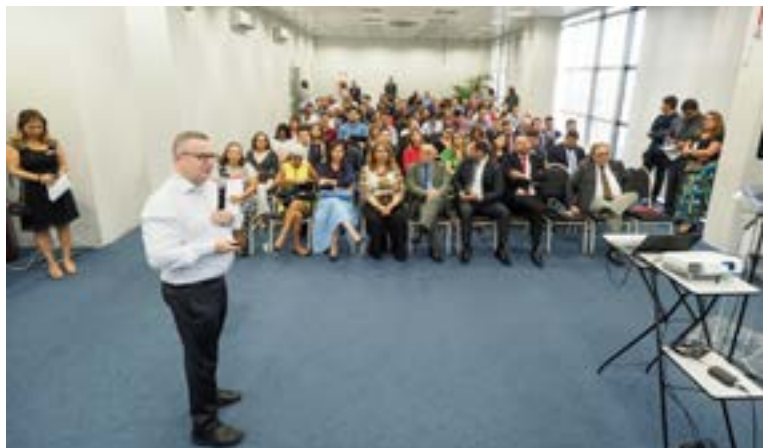
Evento foi realizado no miniauditório do Fórum Trabalhista de Manaus/AM

Em 2020, por conta da pandemia, a cerimônia do prêmio do Concurso de Boas Práticas ocorreu por videoconferência, transmitida ao vivo pelo Canal do TRT11 no YouTube.