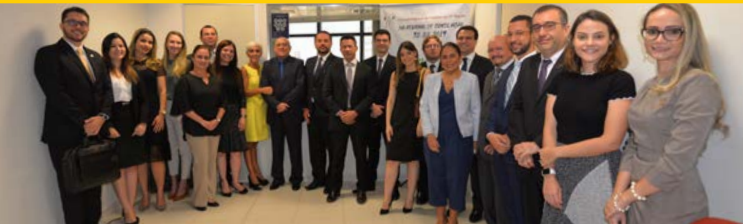
Abertura do Dia Regional da Conciliação em 2019