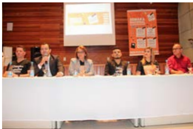
Seminário da Aprendizagem em Manacapuru/AM

A programação do Seminário contou com três painéis que discutiram a visão do poder judiciário quanto à aprendizagem profissional; os desafios e perspectivas da erradicação do trabalho infantil; e as boas práticas do desenvolvimento profissional dos adolescentes.