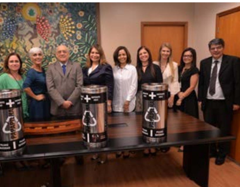
Lançamento do projeto Papa Pilhas