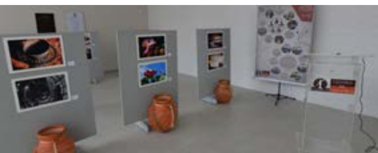
Exposição "Fragmentos Amazônicos"