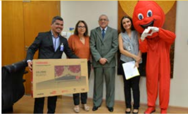
Entrega do prêmio entre os participantes da Semana de Saúde

O evento contou com a participação solidária de servidores, magistrados, terceirizados, amigos, familiares e esteve aberta à comunidade externa. A campanha teve 60 participantes, que doaram um total de 26 bolsas de sangue. Uma televisão foi sorteada entre os participantes.