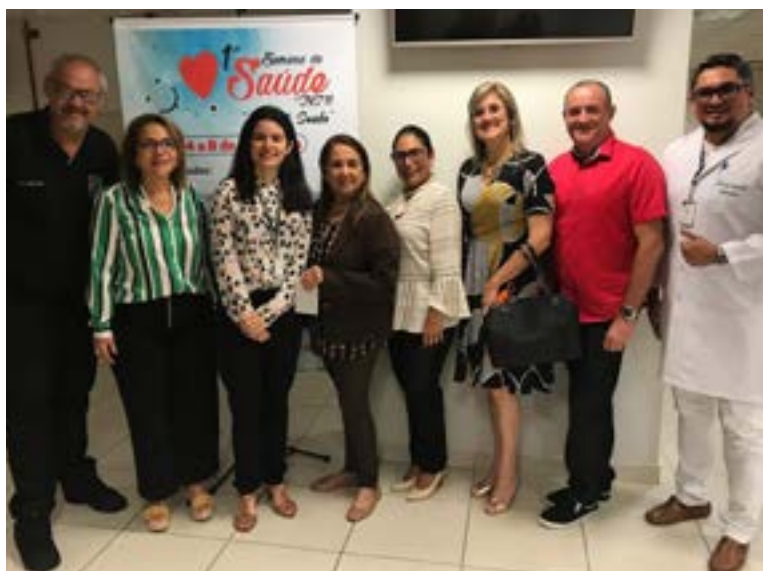
1ª Semana de Saúde foi realizada em 2019

Em 2020, a 2ª edição do evento ocorreu no formato telepresencial, em virtude da pandemia e das recomendações de distanciamento social. A programação contou com palestras, workshop, fóruns de perguntas e repostas, além de práticas de atividades físicas em casa, que foram transmitidas online via YouTube e pelo aplicativo de videoconferência do Google Meet.