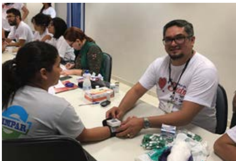
Equipe da Seção de Saúde promoveu mutirão de atendimentos