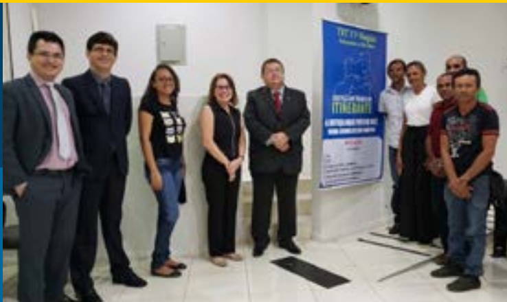
Itinerância em Normandia/RR

que participam da Justiça Itinerante, o autor já fica ciente da data em que será realizada a audiência, que ocorre conforme o calendário de itinerâncias do TRT da 11ª Região.