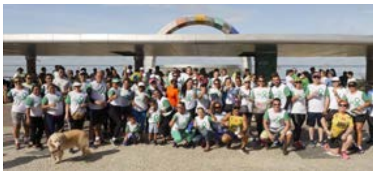
Caminhada Abril Verde