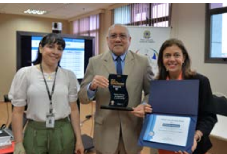
Em 2019, o TRT11 conquistou pelo segundo ano consecutivo o prêmio Diamante