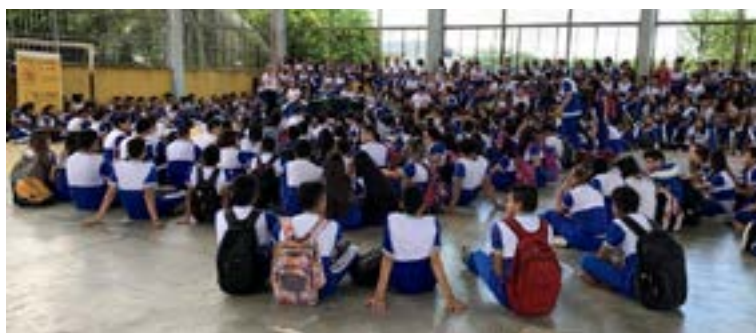
Palestra em Tabatinga/AM