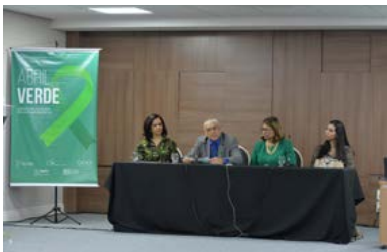
Abertura da campanha de 2019

foi veiculada nas redes sociais oficiais dos órgãos e replicada pelo TRT11.