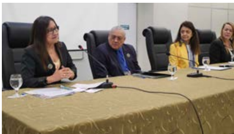
Encontro foi realizado no auditório do Fórum Trabalhista de Manaus em 2019

O Tribunal Regional do Trabalho da 11ª Região, por meio do Centro de Memória, sediou o XI Encontro do Fórum Nacional Permanente em Defesa da Memória da Justiça do Trabalho – Memojutra, nos dias 3 e 4 de outubro de 2019, em Manaus. O encontro teve como tema central “Aspectos da política de preservação do patrimônio documental”. O evento, que acontece semestralmente, reuniu magistrados e servidores atuantes na política de preservação e defesa dos acervos dos tribunais trabalhistas do país.