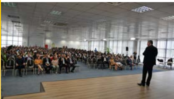
Abertura do Ano Letivo de 2020