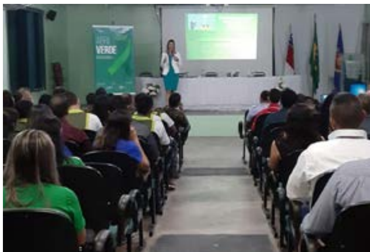
Também foram realizados eventos do Abril Verde em Tabatinga/AM

Neste sentido, o TST e o CSJT criaram a campanha “É tempo de agradecer”, que