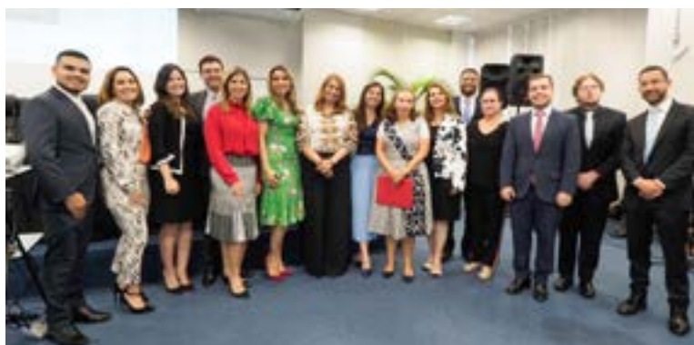
Premiação reuniu magistrados e servidores