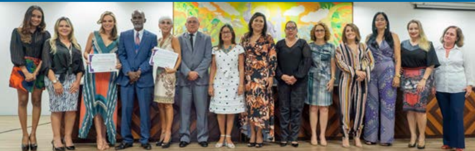
Entrega da 1ª edição do Prêmio Mulheres de Destaque da Justiça do Trabalho, realizada em 2019