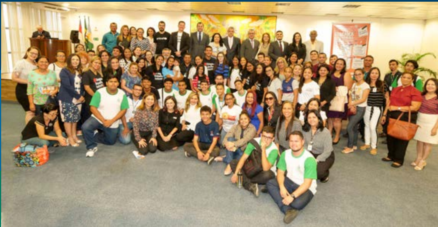
Audiência Pública sobre aprendizagem profissional reuniu mais de 800 pessoas em Manaus