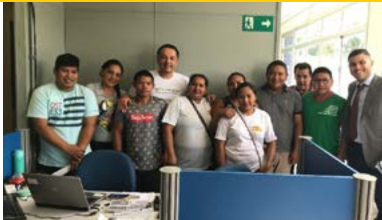
Itinerância em São Gabriel da Cachoeira/AM

Em 2020, em virtude da pandemia, os deslocamentos para a realização de audiências da Justiça Itinerante foram suspensos. Com isso, o orçamento das