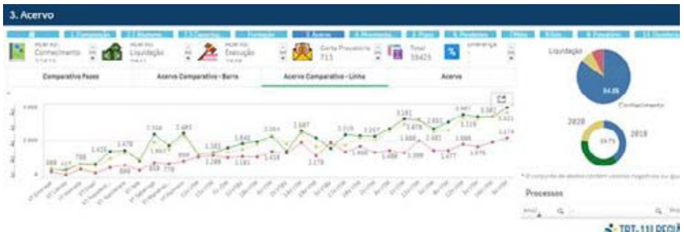
Sistema Hórus, ferramenta que permite o gerenciamento de dados das áreas administrativa e judiciária