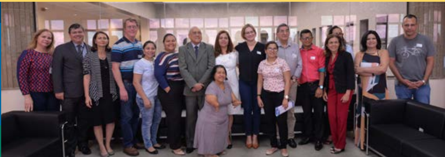
Entidades sociais e órgãos do governo recebem bens do TRT11