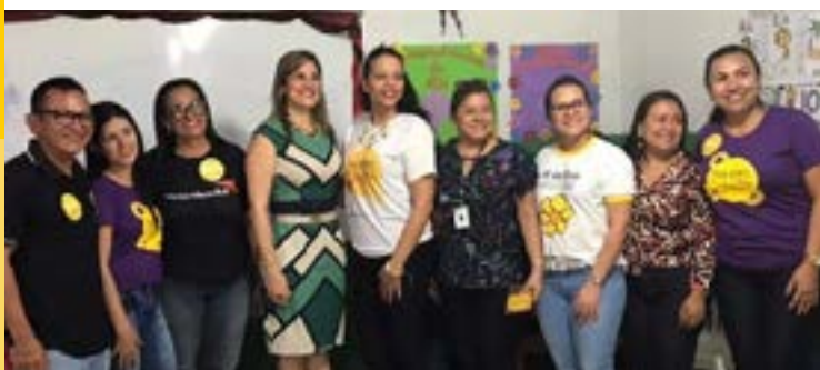
Ação social em Manacapuru/AM