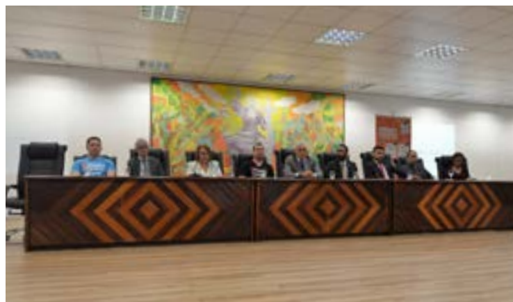
Audiência pública em Manaus/AM