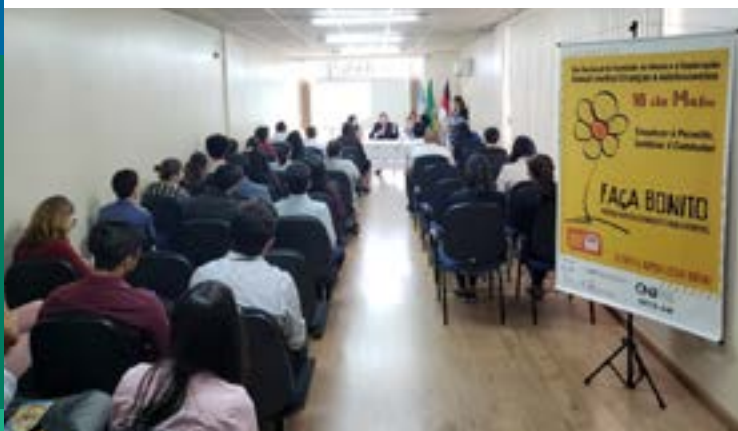
Seminário em Boa Vista/RR

Em toda a Justiça do Trabalho da 11ª Região, no Amazonas e em Roraima, foram realizadas ações de conscientização e mobilização contra o trabalho infantil e a exploração sexual infanto-juvenil. As Varas do Trabalho no interior do Amazonas e também em Boa Vista/RR participaram ativamente das campanhas.