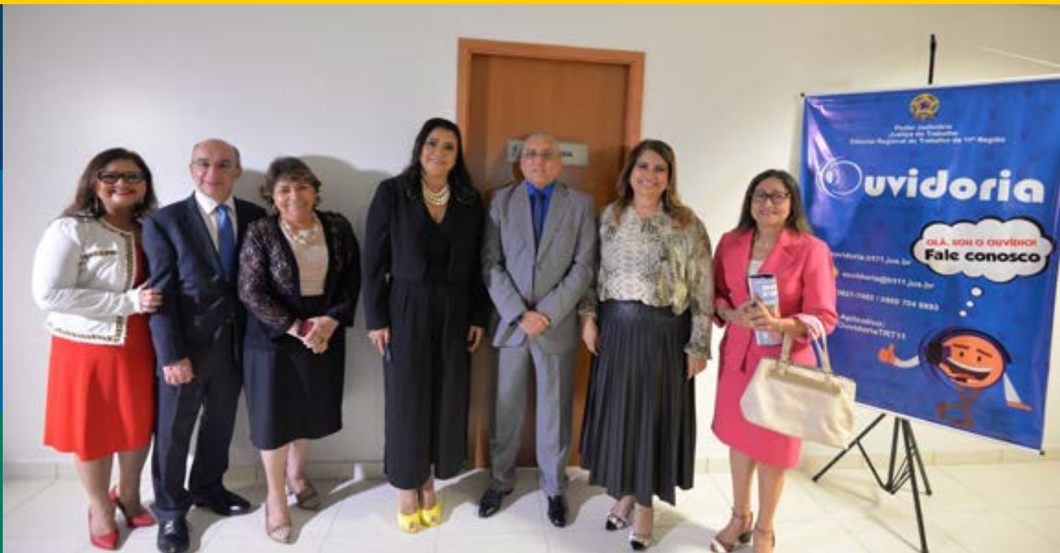
Nova sala fica no Fórum Trabalhista de Manaus/AM