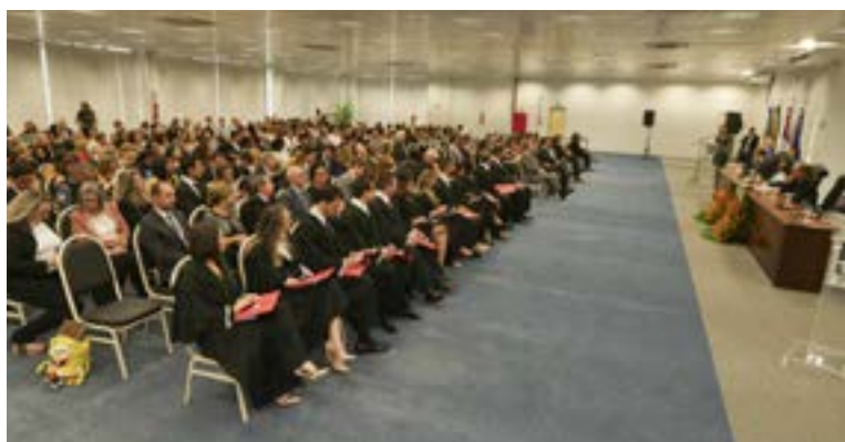
A posse foi realizada no auditório do Fórum Trabalhista de Manaus

O presidente do Tribunal Regional do Trabalho da 11ª Região – Amazonas e Roraima (TRT11), desembargador Lairto José Veloso, deu posse, em abril de 2019, a 12 novos juízes do trabalho. Os novos magistrados foram aprovados no 1º Concurso Público Nacional Unificado para Ingresso na Carreira da Magistratura do Trabalho.