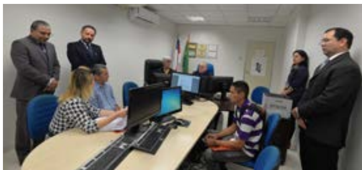
1.130 audiências foram realizadas nas duas edições do evento, em 2019 e 2020

Trata-se de um dia dedicado exclusivamente para a realização de audiências de conciliação para tentativas de acordo e tem como slogan "Diga SIM à conciliação e mediação e NÃO ao conflito". Na primeira edição do evento, em 2019, foram realizadas 722 audiências de conciliação, que terminaram em 256 acordos homologados. Ao todo, mais de R$ 2,6 milhões em créditos trabalhistas foram negociados e pagos.