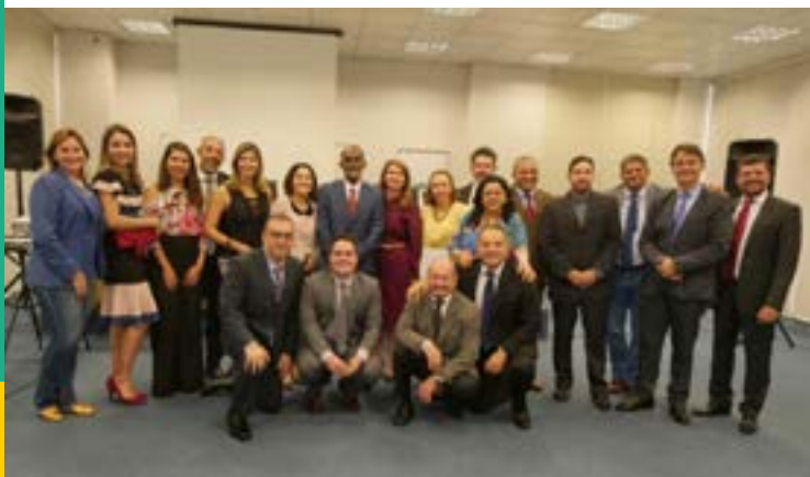
Jornada Institucional dos Magistrados em Manaus/AM

Uma destas ações que, de forma inédita, ocorreu em ambiente 100% virtual foi a edição da Jornada Institucional dos Magistrados (Jomatra) em outubro de 2020.