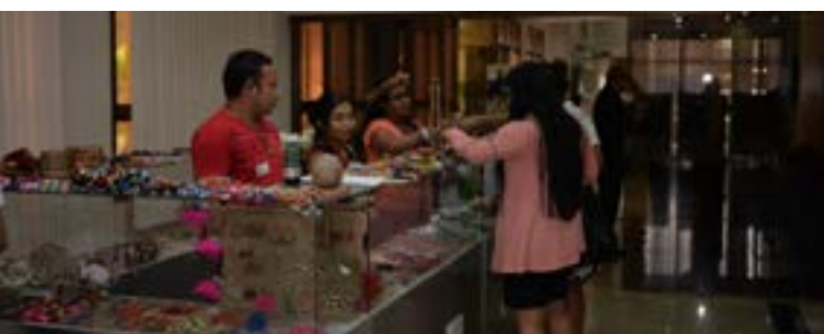
Exposição e venda de artesanato indígena

Durante o biênio 2018/2020, o Cemej11 também promoveu exposições artísticas temporárias, contribuindo para a difusão da produção cultural e artística local. Confira: