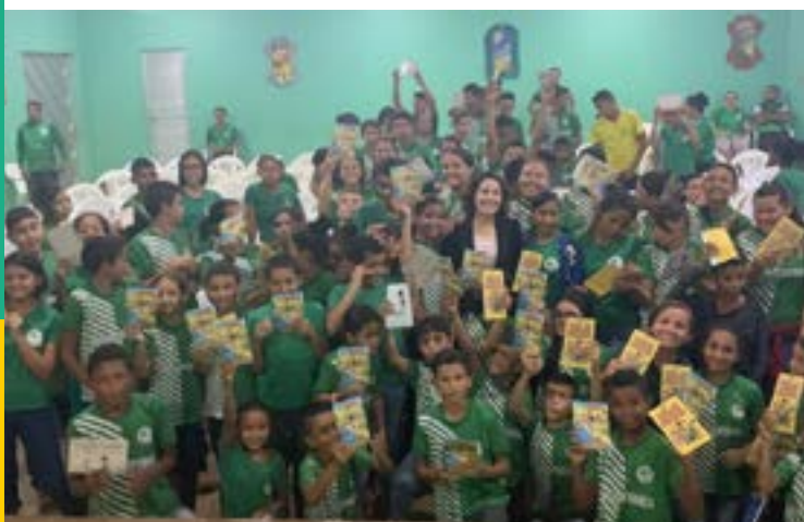
Palestra em Pauini/AM