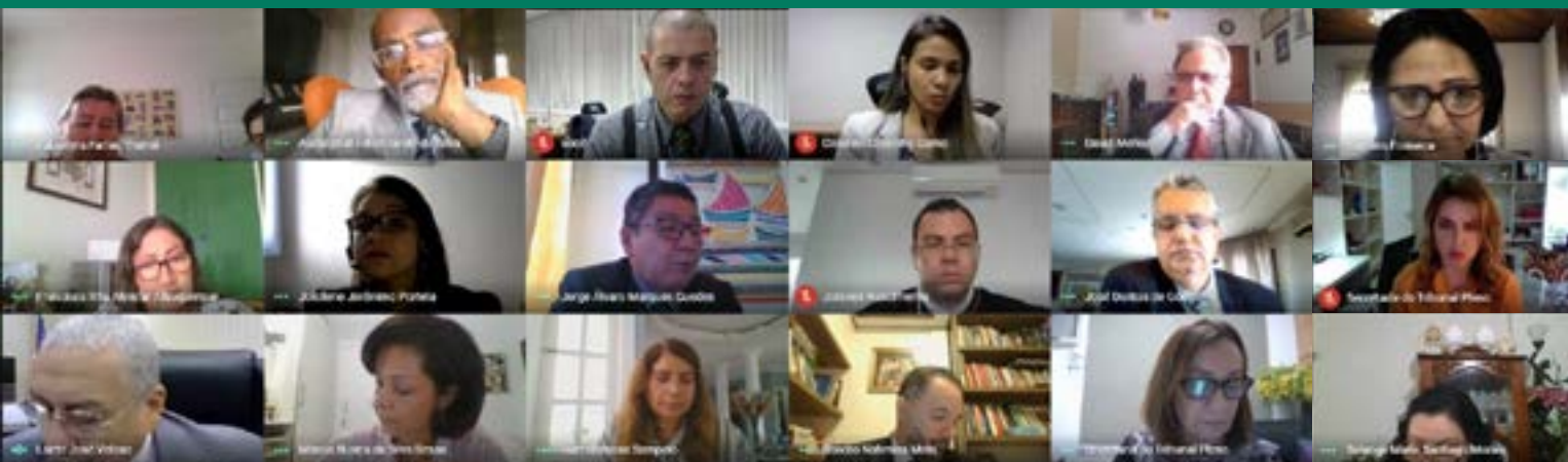
Primeira sessão telepresencial do Tribunal Pleno