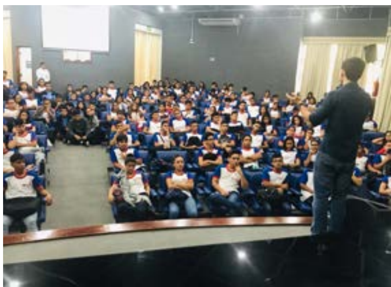
Palestra no SENAI