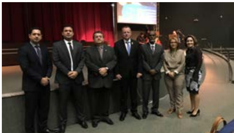
Seminário Roraimense de Direito e Processo do Trabalho