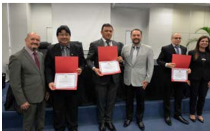
33 entes públicos receberam o Certificado Negativo de Precatórios

A finalidade da ação é solucionar mais de 576 processos que se acumulam nas Varas do Trabalho, visando reduzir a taxa de congestionamento e aumentar a efetividade da execução. Ao todo, com o apoio da Controladoria Geral da União - CGU, foram investigadas 3 empresas e identificados bens como um avião, uma lancha, além de veículos e joias.