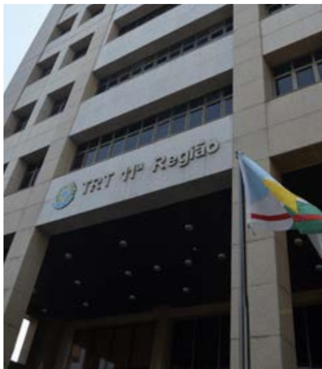
Tribunal arrecadou mais de R$ 187 milhões

O balanço também aponta que o Tribunal solucionou, na primeira e segunda instâncias, 70.221 processos envolvendo litígio entre trabalhadores e empregadores, enquanto 70.329 ações foram ajuizadas.