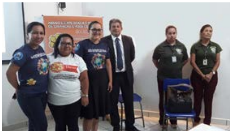
Palestra em Tefé/AM