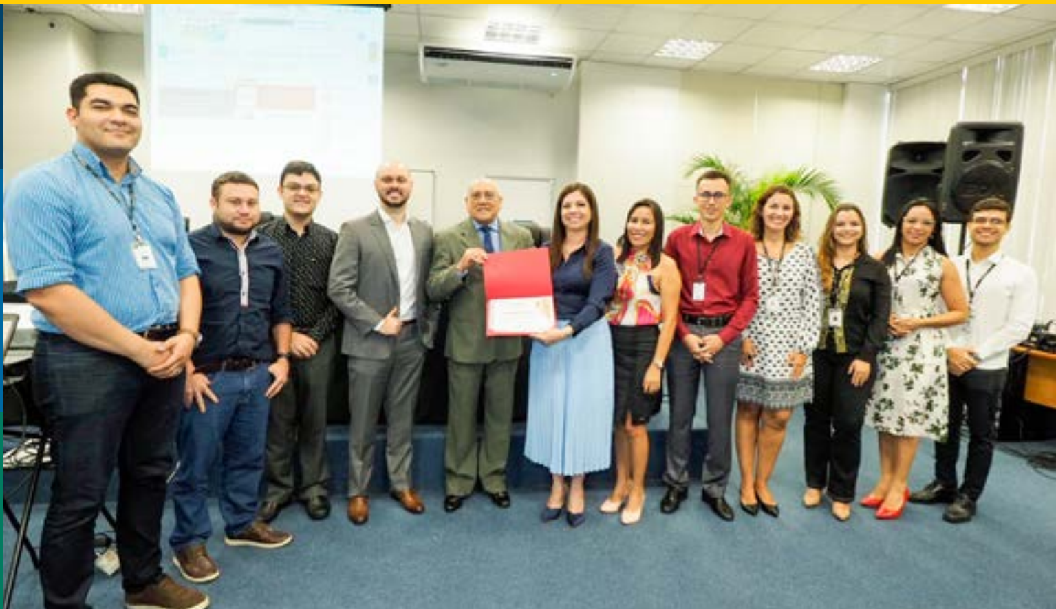
Selo 11 Mérito Corregedoria foram entregues às Varas do Trabalho que se destacaram em suas atividades

A Corregedoria também outorga o Selo 11 Mérito Corregedoria às Varas do Trabalho do Regional que se destacam no desempenho de suas atividades. De acordo com as faixas de pontuação, são concedidos os Selos Diamante, Ouro ou Prata. Para a premiação, são analisados aspectos relacionados à produção, gestão, organização e disseminação das informações administrativas e processuais.