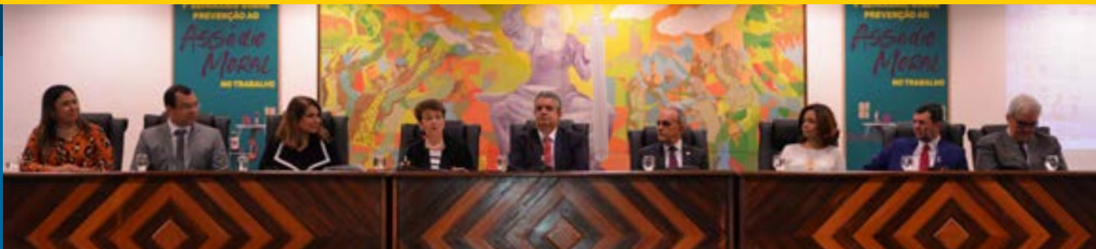
Evento inédito foi realizado no Fórum Trabalhista de Manaus/AM