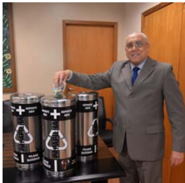
Pontos de coleta foram espalhados pelas unidades do TRT11