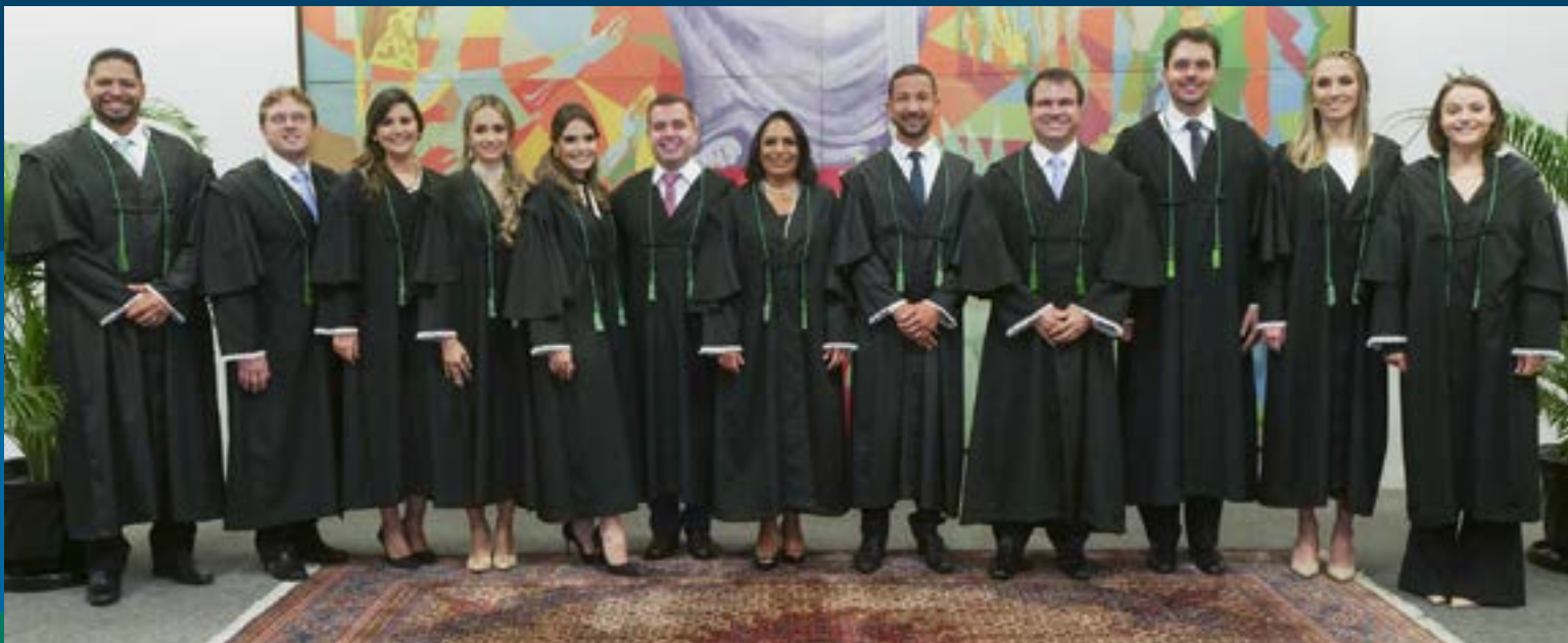
Magistrados foram aprovados no 1º Concurso Público Nacional Unificado