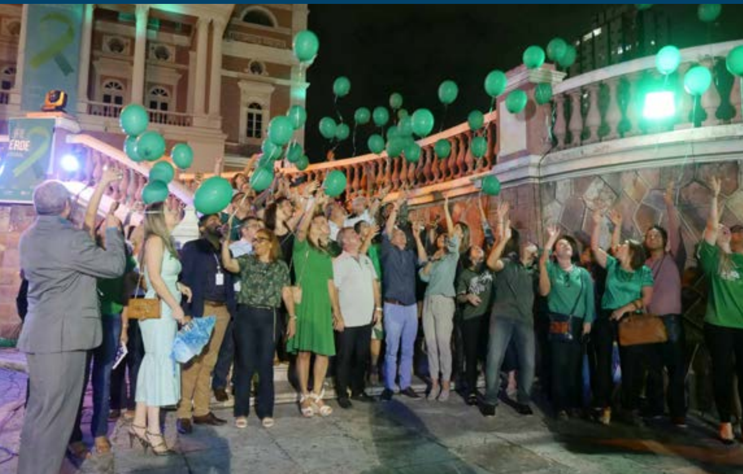
Ato Público da campanha Abril Verde