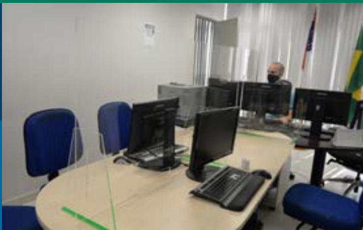
Sala de audiência com divisórias em acrílico