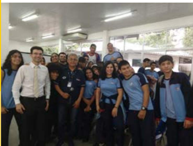
Palestra no SESI

Em 2020, em virtude da necessidade de isolamento social imposta pela pandemia do coronavírus, as palestras foram realizadas no formato virtual.