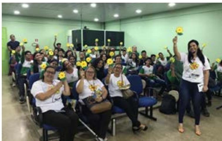
Palestra em Coari/AM