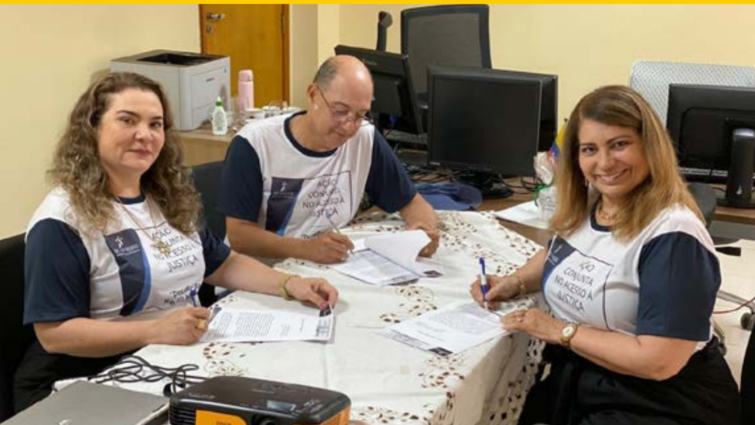
TRTs do Norte assinam carte de compromisso para a união de esforços