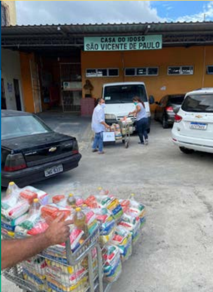
Doações foram entregues a instituições sociais