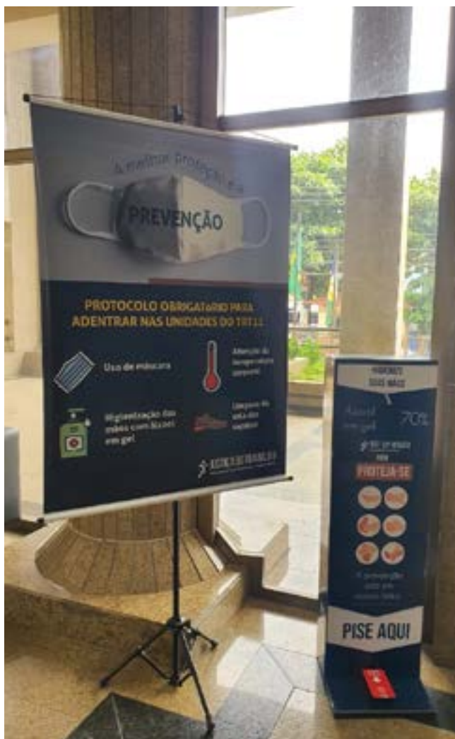
Totens de álcool em gel foram instalados nas unidades do Regional

visual para divulgar os protocolos de saúde e prevenção à Covid-19.