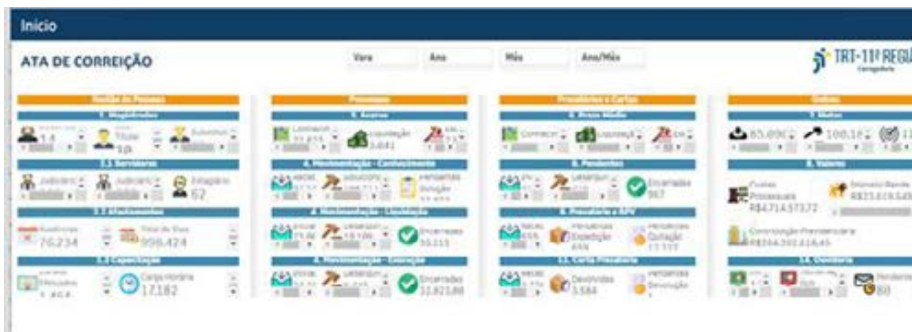
Tela principal da seção Ata de Correição com as ferramentas disponíveis

Com o novo módulo do sistema Hórus TRT11, magistrados e servidores das Varas do Trabalho e da Corregedoria Regional poderão ter uma visão mais completa e detalhada da vara, identificando com precisão os processos que estão com mais tempo sem movimentação, os processos que estão contaminando a estatística da Vara, além de todos os dados sobre movimentações processuais.