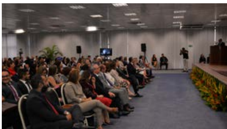
Evento reuniu quase 500 participantes