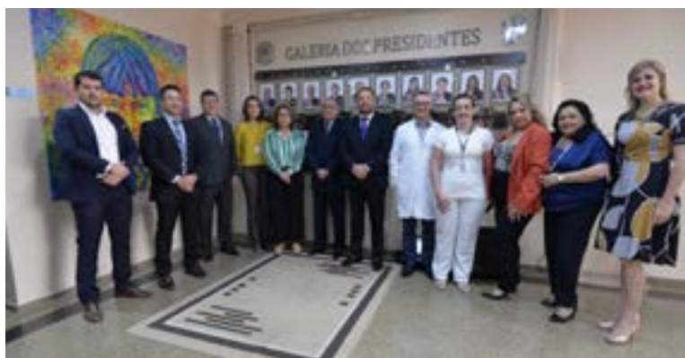
Abertura da 1ª Semana de Saúde