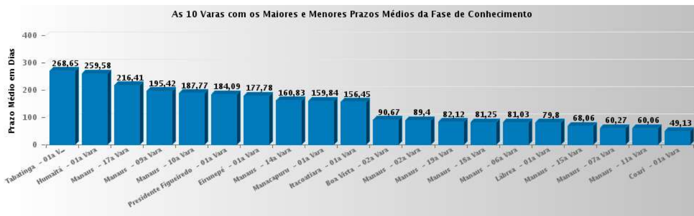
Figura 1. As 10 Varas com Maiores e Menores Prazos Médios, respectivamente, na Fase de Conhecimento, liquidação, execução e do ajuizamento até o arquivamento definitivo dos autos

Os gráficos abaixo foram extraídos do sistema e-Gestão (Relatórios Gerenciais - Das Varas - Prazos Médios – A.4.4 – aba 2 Gráficos por VT) e mostram a colocação das 10 Varas do Trabalho do TRT11 com maior e menor prazo médio por fase processual, respectivamente.