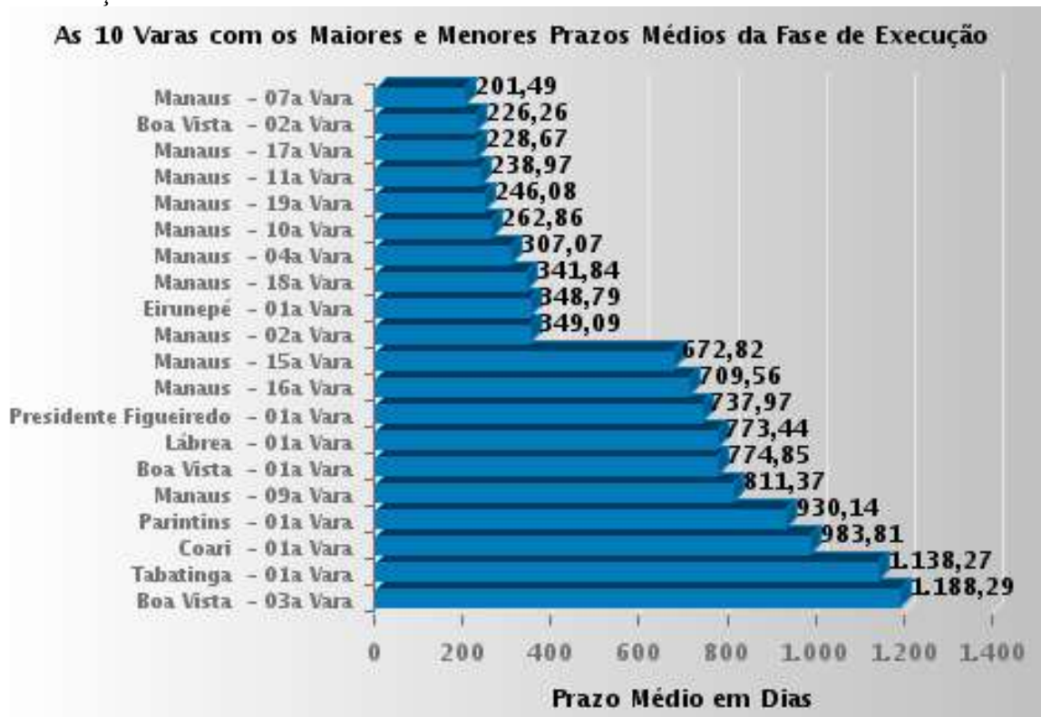
Figura 3. As 10 Varas com Maiores e Menores Prazos Médios, respectivamente, na Fase de Execução