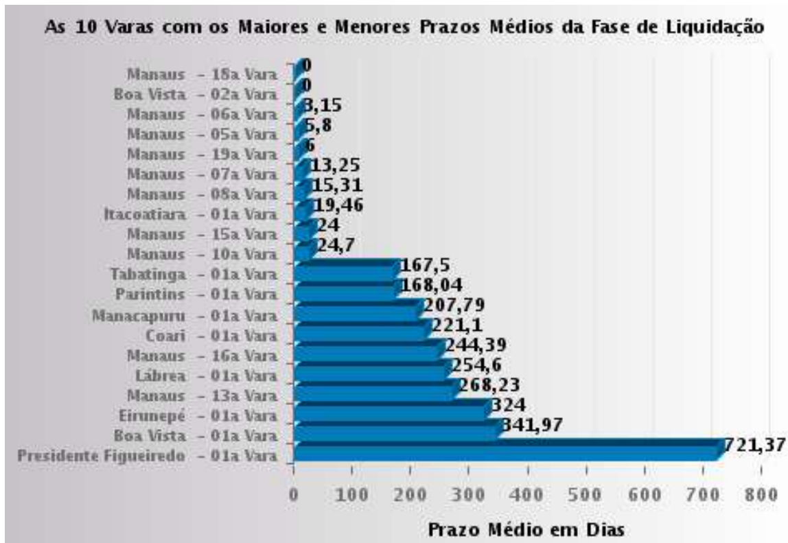
Figura 2. As 10 Varas com Maiores e Menores Prazos Médios, respectivamente, na Fase de Liquidação