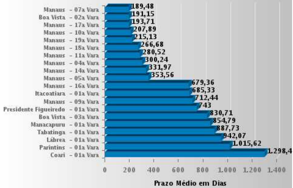
As 10 Varas com os Maiores e Menores Prazos Médios da Fase de Execução