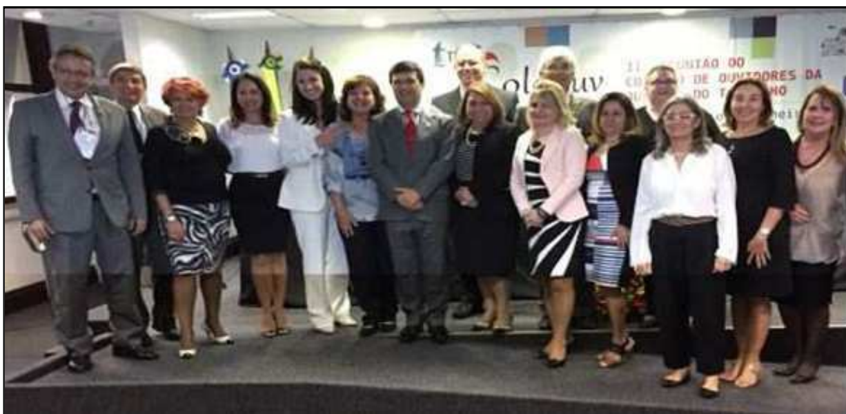
Última reunião do COLEOUV no Rio de Janeiro.