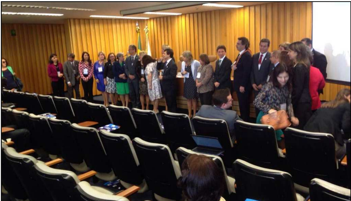
Ultima reunião e posse dos novos dirigentes do COLEPRECOR.