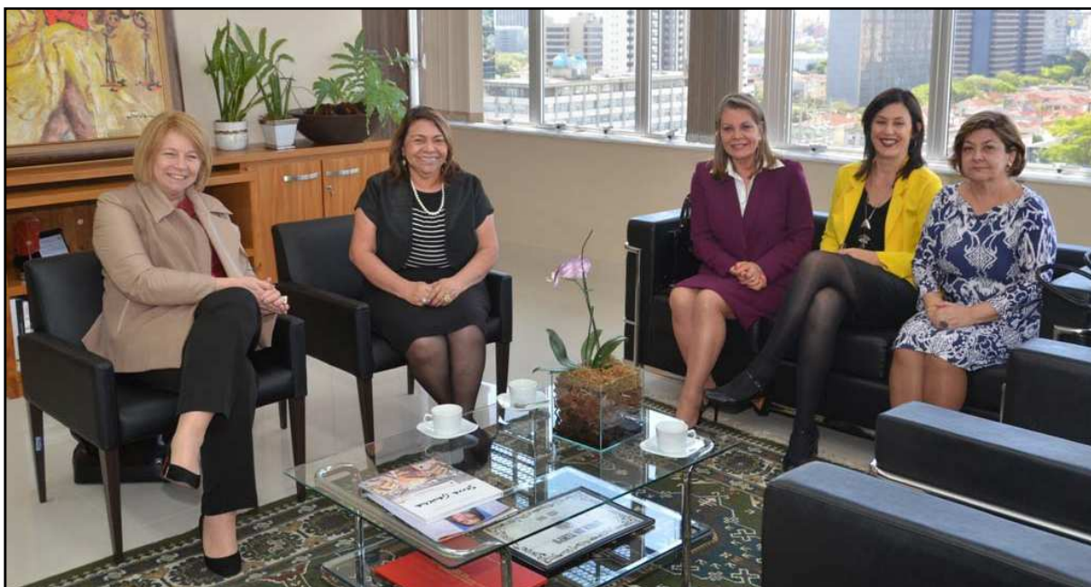
Corregedora em visita técnica ao TRT 4ª Região.